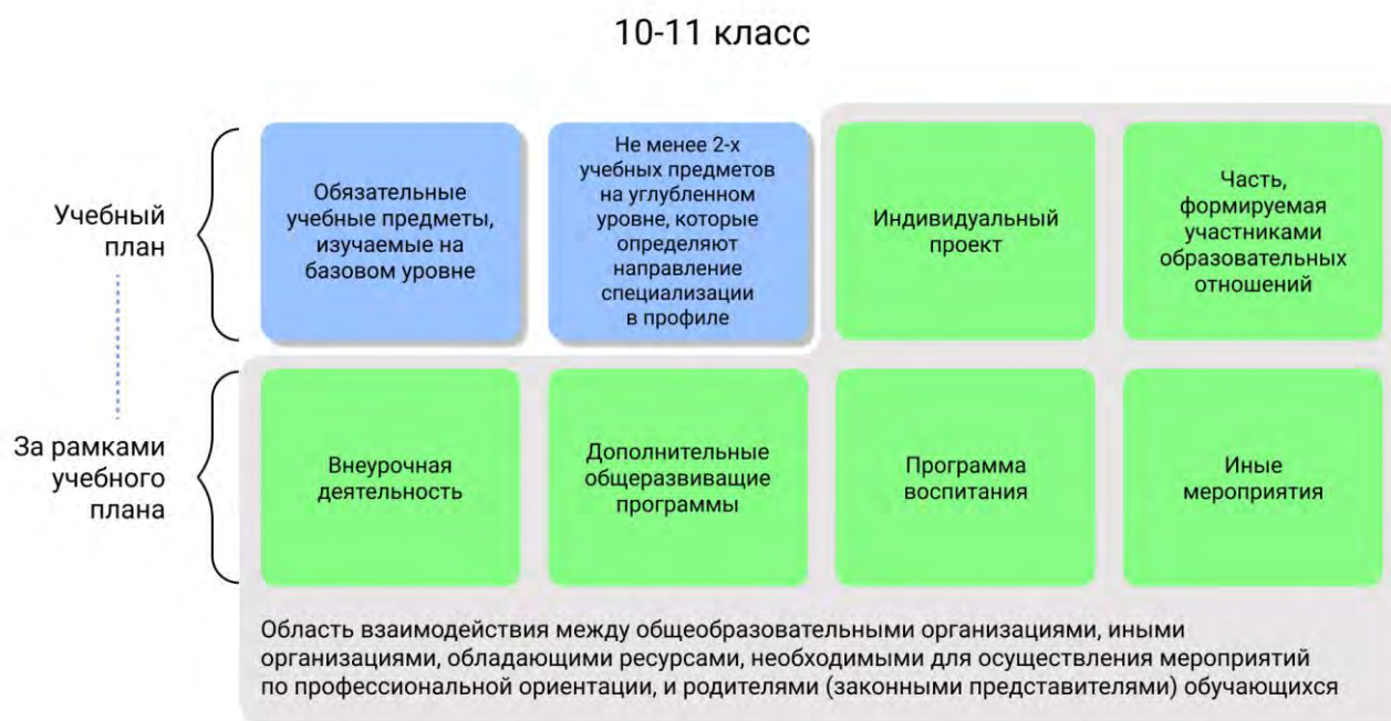
Рисунок 1 – Единая модель профориентации в профильных предпрофессиональных классах – область взаимодействия между общеобразовательными организациями и партнерами

Разработка основной образовательной программы для профильных предпрофессиональных классов проводится с учетом мнения всех категорий участников Единой модели профориентации, представленных на уровне субъекта Российской Федерации, муниципалитета.